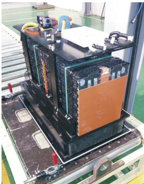
Eine Lithium-Eisenphosphat-Batterie für die neuen BYD-Flurförderzeuge

Mit der Erfahrung, die BYD über die Jahre mit eigenen elektrisch angetriebenen Fahrzeugen im öffentlichen Bereich gesammelt hat, war der Beginn einer Flurförderzeugproduktion im Jahr 2012 nur eine logische Folge. Deshalb haben die Chinesen 2013 in Shaoguan im Norden der Provinz Guang-