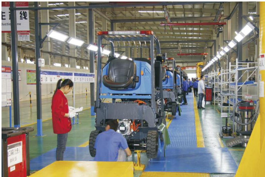
Der BYD Shaoguan Industrial Park dient ausschließlich der Produktion von Flurförderzeugen. Das im Jahr 2013 in Betrieb genommene Werk ist für 50 000 Einheiten pro Jahr ausgelegt