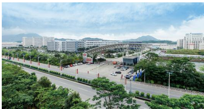
Die BYD-Firmenzentrale in Shenzhen, nahe Hongkong

genfertigung. Die Lithium-Eisenphosphat-Batterie (korrekt: Lithium-Eisenphosphat-Akkumulator) darf sich unbestritten zu den herausragenden Innovationen der Gegenwart zählen. Der Energiespeicher ist die Ausführung eines Lithium-Ionen-Akkumulators mit einer Zellspannung von 3,2 beziehungsweise 3,3 Volt. Als Kathodenmaterial wird Lithium-Eisenphosphat (LiFePO 4 ) anstelle von herkömmlichem Lithium-Kobalt(III)-oxid (LiCoO 2 ) verwendet.