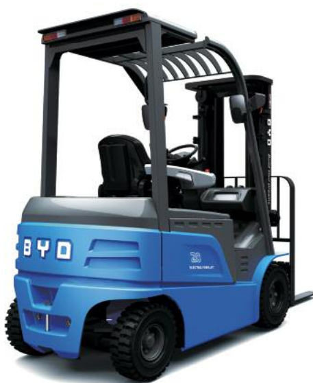
Der vierrädrige Elektrogegengewichtsstapler ECB20 von BYD Forklifts mit einer Tragfähigkeit von bis zu 2 Tonnen

Herzstück der Elektroflurförderzeuge und der anderen ‚grünen‘ Fahrzeuge ist die Lithium-Eisenphosphat-Batterie, die der weltgrößte Batteriehersteller aus dem südchinesischen Shenzhen selbst produziert. Überhaupt geht BYD nicht den schnelleren Weg der Nutzung von Lizenzbauten globaler Konzerne, sondern setzt auf Eigenentwicklungen und Ei-