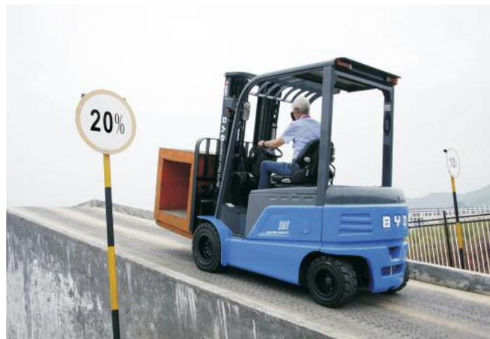
Der Bremsassistent hält das Fahrzeug an Steigungen und Gefällen nach dem Lösen der Bremse in der Position

aufzustellen, sodass die Fahrer den Stapler nur eben kurz abstellen und aufladen können, ohne dazu durch das ganze Lager zu einer abseits gelegenen Ladestation fahren zu müssen. „Auch lässt sich die gesamte Einsatzzeit um ein paar Stunden verlängern.“ Außerdem habe sie, wie der Geschäftsführer weiter betont, eine beträchtlich längere Lebensdauer, sodass – zum ersten Mal überhaupt – die Batterie während des üblichen Flurförderzeuglebens nicht mehr ersetzt werden müsse. „LiFePO 4 -Zellen können jederzeit zwischengelagert, entladen und geladen werden. Nur im vollständig geladenen und nahezu entladenen Zustand sind längere Lagerzeiten der Lebenserwartung abträglich“, so Contijoch. Wie man bei BYD weiter betont, sei das Aufladen nicht nur äußerst schnell und flexibel,