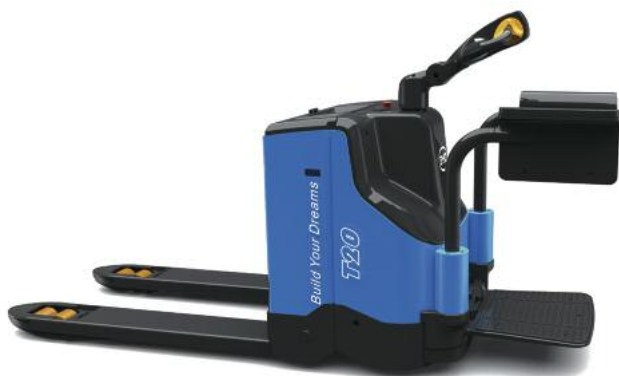
Der Elektroniederhubwagen PTP20 von BYD Forklifts für bis zu 2 Tonnen schwere Traglasten

geschieht außerdem sehr viel sauberer als bei anderen Batterietechnologien“, betont der Manager. „Es werden im Gegensatz zu Bleibatterien, die auch nur in entsprechend ausgestatteten Bereichen aufgeladen werden dürfen, keine giftigen Schadstoffe freigesetzt.“ Auch das Thema Sicherheit sprach Contijoch